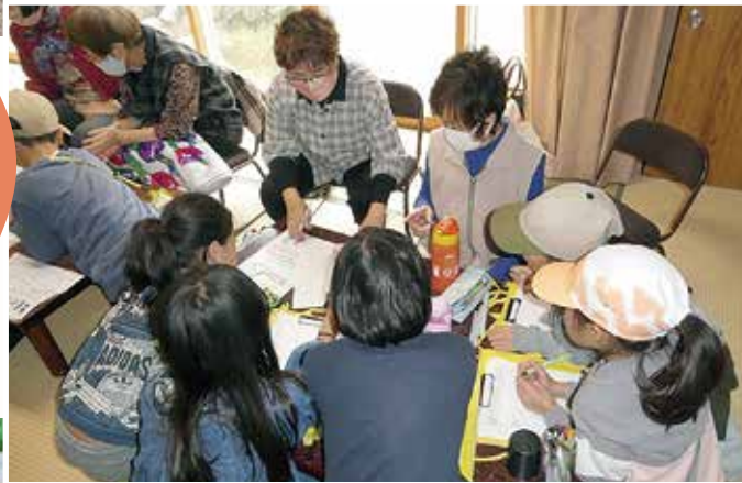
←大日向サロンの皆さんと養蚕の話に熱心に耳を傾ける大日向小学校の児童達